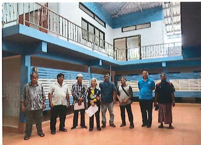
อุดหนุนมัสยิดฮิดายัตุสซาลีเก็น อำเภอบางละมุง โครงการต่อเติมอาคารศูนย์ฝึกอบรมจริยธรรม งบประมาณ 500,000 บาท โครงการอยู่ในระดับความสำเร็จ