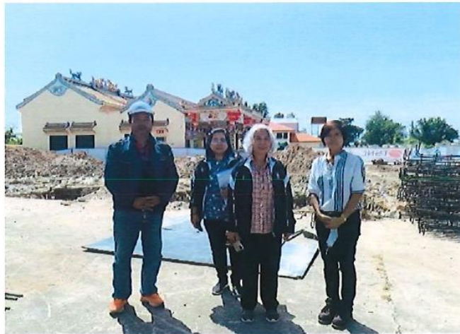
อุดหนุนมูลนิธิเกาะโพธิ์โพธิญาณ ตำบลท่าบุญมี อำเภอเกาะจันทร์ โครงการก่อสร้างอาคารอเนกประสงค์ งบประมาณ 14,000,000 บาท โครงการอยู่ในระดับความสำเร็จ