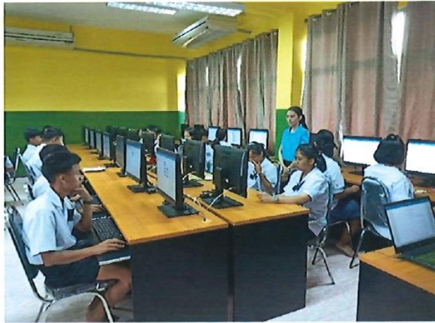
อุดหนุนโรงเรียนวัดสุกรีบุญญาราม อำเภอบางละมุง โครงการจัดทำห้องปฏิบัติการคอมพิวเตอร์ งบประมาณ 1,802,900 บาท โครงการอยู่ในระดับความสำเร็จ