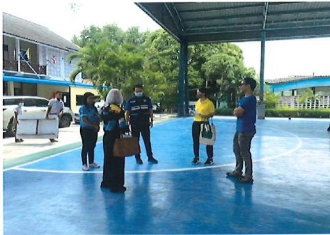
โครงการติดตั้งตาข่ายกันนกและตาข่ายกันฟุตบอล อาคารอเนกประสงค์โรงเรียนวัดยุคศรราชฎ์สามัคคี อำเภอบ้านทอง งบประมาณ 457,000 บาท โครงการอยู่ในระดับความสำเร็จ