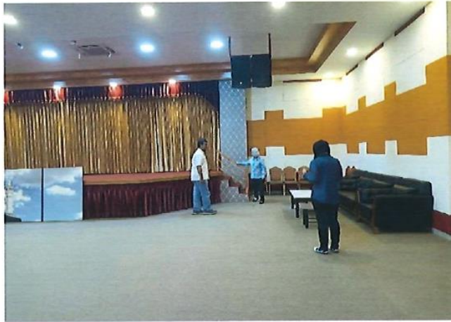
อุดหนุนคณะกรรมการอิสลามประจำจังหวัดชลบุรี อำเภอบางละมุง โครงการปรับปรุงอาคารสำนักงานฯ งบประมาณ 4,000,000 บาท โครงการอยู่ในระดับความสำเร็จ