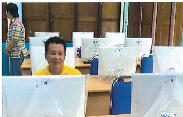
อุดหนุนโรงเรียนบ้านซากนา อำเภอหนองใหญ่ โครงการจัดทำห้องปฏิบัติการคอมพิวเตอร์ งบประมาณ 1,239,900 บาท โครงการอยู่ในระดับความสำเร็จ