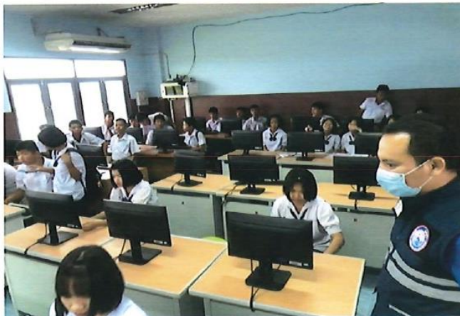
อุดหนุนโรงเรียนวัดโป่งตามุข อำเภอบ้านทอง โครงการของงบประมาณสนับสนุนจัดซื้อคอมพิวเตอร์ งบประมาณ 505,000 บาท โครงการอยู่ในระดับความสำเร็จ