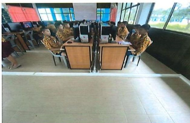
อุดหนุนโรงเรียนอนุบาลหนองใหญ่ อำเภอหนองใหญ่ โครงการพัฒนาห้องปฏิบัติการคอมพิวเตอร์เพื่อการศึกษาเสริมสร้างปัญญา งบประมาณ 1,383,100 บาท โครงการอยู่ในระดับความสำเร็จ