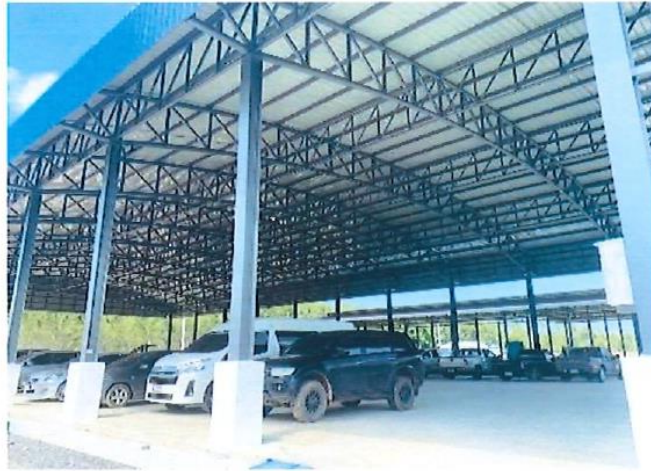
โครงการก่อสร้างอาคารอเนกประสงค์ เทศบาลเมืองปรกฟ้า (โตมคลุมลานอเนกประสงค์) อำเภอเกาะจันทร์ งบประมาณ 4,650,000 บาท โครงการอยู่ในระดับความสำเร็จ