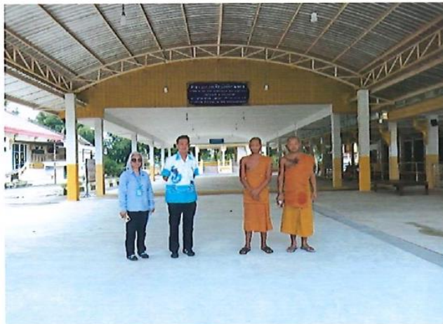
อุดหนุนวัดเขาไม้แก้ว อำเภอบางละมุง โครงการก่อสร้างอาคารอเนกประสงค์ งบประมาณ 1,000,000 บาท โครงการอยู่ในระดับความสำเร็จ